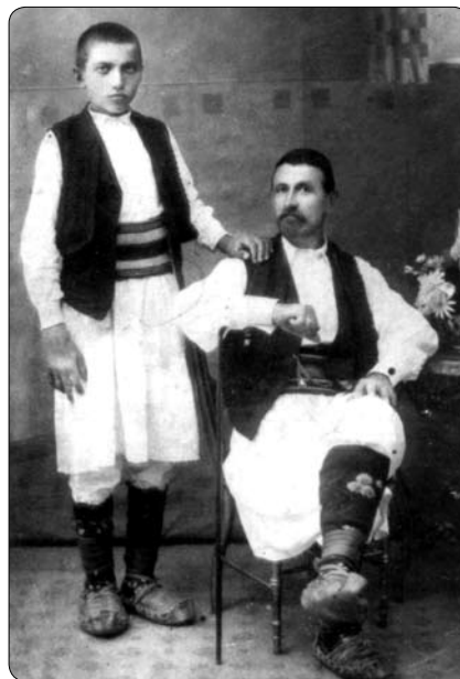
Отец и сын, Србија 19. век

«нашки» язык, он этого не знает. Он не знает название этого языка, потому что и у него самого нет единой отчизны и нет единого названия. Кроме узкого региона, в котором он проживает, для него существует только одна родина-римскокатолическая церковь. Поэтому серб-католик называет себя крестианином , так же как серб-православный называет себя ристианином . Оба эти выражения обозначают по сути одно и то же слово христианин , только по-разному произносят его.