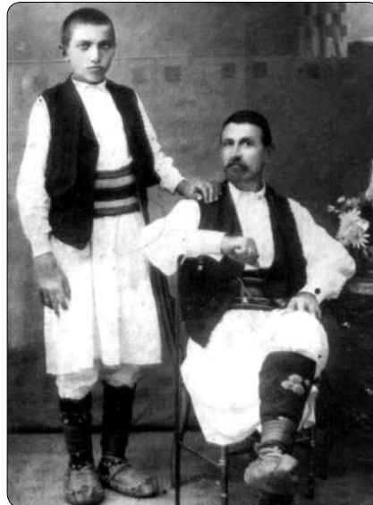
Отац и син, Србија 19. век

ца: 'Умјете ли ви нашки?' Али шта значи нашки језик, он не зна. Он не зна име тога језика, јер ни сам нема заједничке домовине нити заједничког народног имена. Сем уже покрајине, за њега постоји само једна отаџбина – римокатоличка црква. Зато Србин католик назива себе кршћанином исто онако као што православлац назива ришћанином . Оба ова израза означавају, у ствари, једну те исту ријеч хришћанин , само различито изговорену.