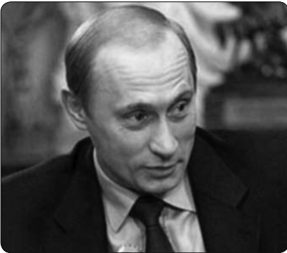
Председник Владимир Путин